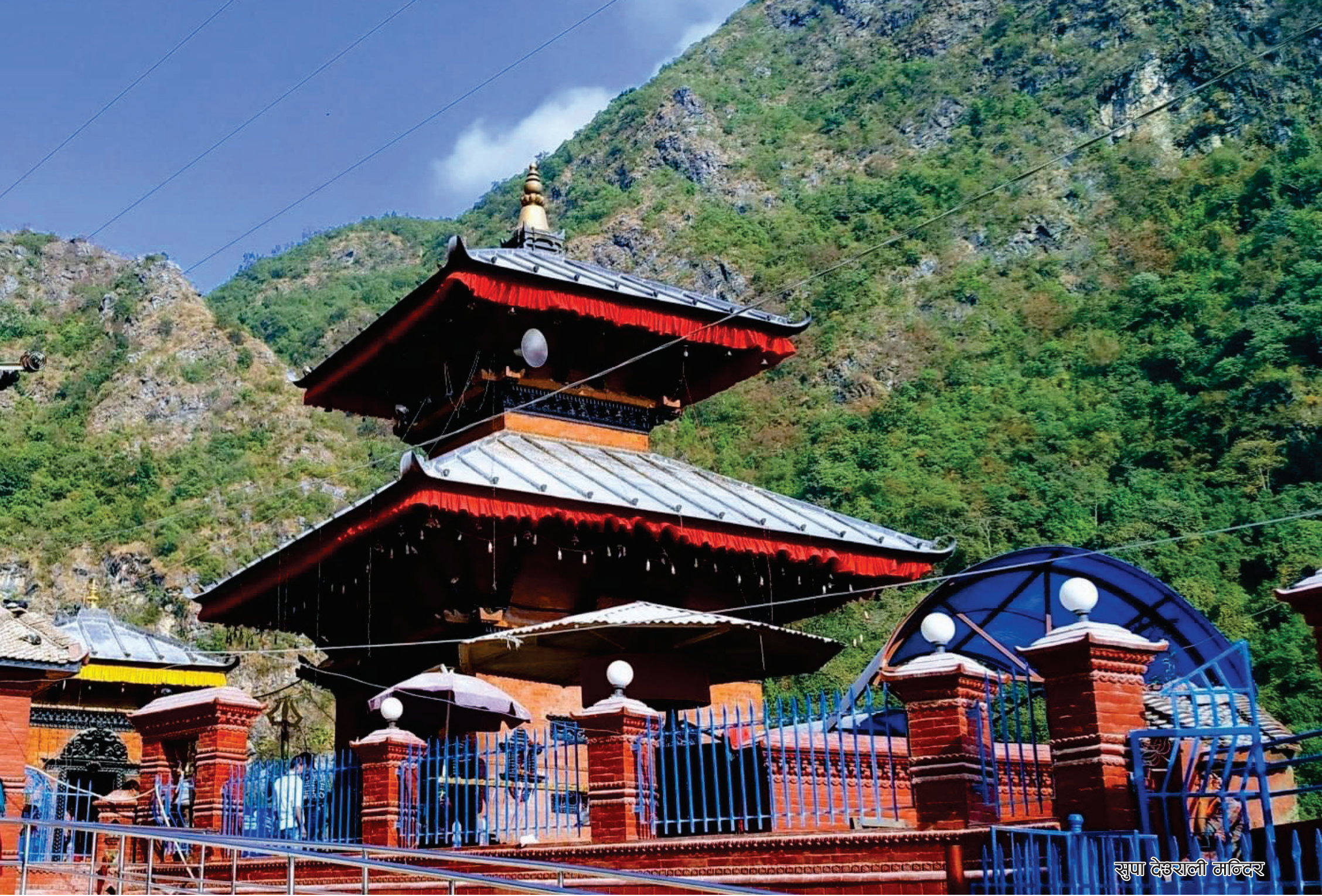
सुष्पा देवस्थली मन्दिर